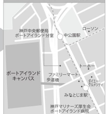
ポートアイランドキャンパス周辺マップ